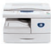
másolás ; nyomtatás

Ha további információra van szüksége, kérem forduljon a helyi Xerox márkaképviselőhöz vagy látogasson el weboldalunkra: www.xerox.hu