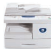
másol ; nyomtat ; szkennel ; faxol