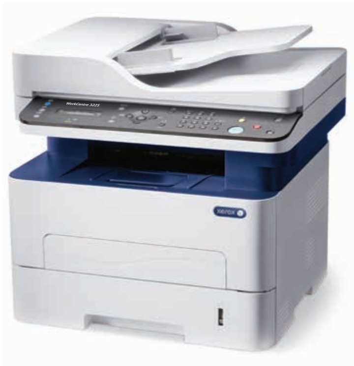
WorkCentre 3225. Másol. Nyomtat. Szkennel. Faxol. E-mailt küld.