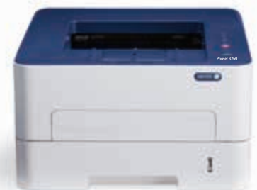
Phaser 3260. Nyomtat.