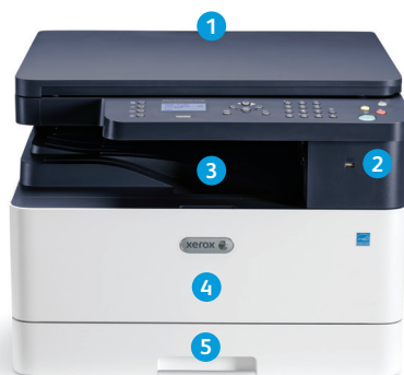
Xerox® B1022 többfunkciós nyomtató

9 A Xerox® B1025 nagyobb, 4,3 colos, színes érintőképernyővel rendelkezik, ami még egyszerűbbé teszi a használatot.