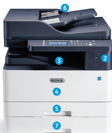
Xerox® B1025 többfunkciós nyomtató DADF-konfiguráció opcionális kiegészítő tálccával.