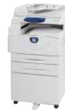
WorkCentre 5020DN automatikus duplex dokumentumadagolóval, opcionális 2. tálca és állvány

UL – 60950 – 1 / CSA – 60950 – 1 – 03, EC irányelv szerint alkalmazandó CE-jelölés 2006 / 95 / EC, 2004 / 108 / EC, 1999 / 5 / EC