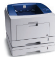
A Phaser 3435 az opcionális 2 . tálccával