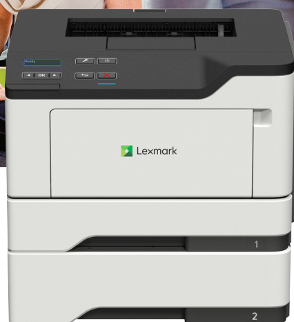
B2442dw külön megvásárolható tálcával