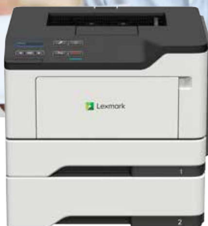
B2338dw külön megvásárolható tálcával