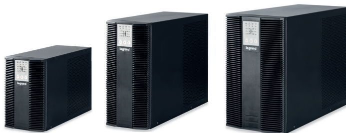
3 101 54