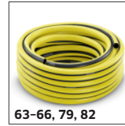
63-66, 79, 82