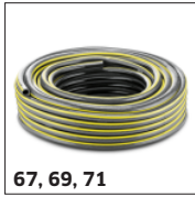
67, 69, 71