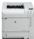
HP LaserJet P4014n nyomtató