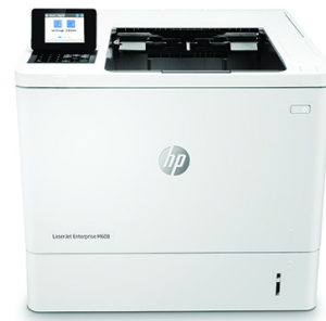
HP LaserJet Enterprise M608dn