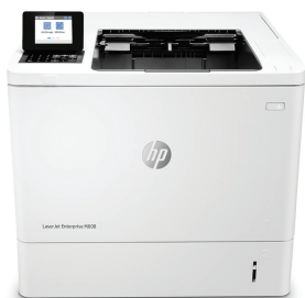
HP LaserJet Enterprise M608dn