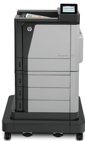
HP Color LaserJet Enterprise M651xh nyomtató