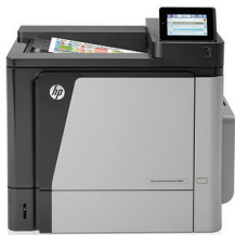
HP Color LaserJet Enterprise M651dn nyomtató

Megbízható teljesítmény: nagy volumenű, professzionális minőségű, kétoldalas színes dokumentumok és kimagasló megbízhatóság. A hatékony egyérintéses és mobil nyomtatási lehetőségeknek, valamint az egyszerű kezelhetőségnek köszönhetően bárhol hatékonyan dolgozhat munkája során.