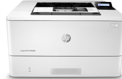
HP LaserJet Pro M404dn

Ez a nyomtató kizárólag új, illetve újrahasznosított HP chippel rendelkező patronokkal használható, és dinamikus biztonsági intézkedéseket alkalmaz a nem HP chippel rendelkező patronok blokkolására. Az időszakos firmware-frissítések fenntartják ezen intézkedések hatékonyságát, és blokkolják a korábban még működő patronokat. Az újrahasznosított HP chip lehetővé teszi az újrahasznosított, felújított és újratöltött patronok használatát. További információk: http://www.hp.com/learn/ds