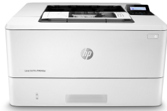
HP LaserJet Pro M404dw

Ha sikeressé szeretné tenni vállalkozását, okosabb megoldásokra kell támaszkodnia. A HP LaserJet Pro M404 nyomtatóval a lehető leghatékonyabban használhatja ki az idejét, ami segít az üzlet felvirágoztatásában és abban, hogy megőrizze helyét az élmezőnyben.