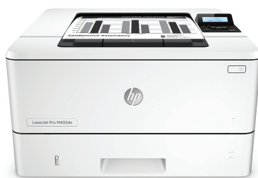
HP LaserJet Pro M402dn

A munkastílusára szabott nyomtatási teljesítmény és erőteljes biztonság. Ez a sokoldalú nyomtató gyorsabban elvégzi a feladatokat, és átfogó biztonsági szolgáltatásai révén véd a fenyegetésektől. 1 A JetIntelligence technológiás eredeti HP tonerkazettákkal több oldal nyomtatható. 2