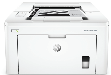
HP LaserJet Pro M203dw nyomtató