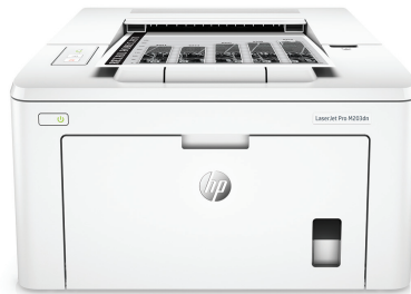
HP LaserJet Pro M203dn nyomtató

Nagyobb teljesítményt, oldalszámot és védelmet érhet el a JetIntelligence tonerkazettával használt, vezeték nélküli HP LaserJet Pro készülékkel. Hozza lendületbe vállalatát: kétoldalas dokumentumokat nyomtathat azonnal, és könnyedén végezheti a felügyeletet a maximális hatékonyság érdekében.