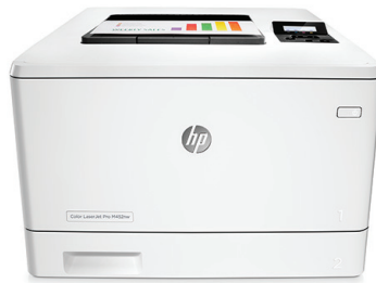
HP LaserJet Pro M452dn

Ideális nyomtatási teljesítmény és erőteljes biztonság a munkájára szabva. Ez a sokoldalú, színes nyomtató gyorsabban elvégzi a feladatokat, és átfogó biztonsági szolgáltatásai révén véd a fenyegetésektől. A JetIntelligence technológiás eredeti HP tonerkazettákkal több oldal nyomtatható 2 .