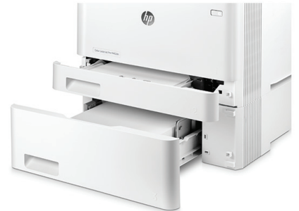
HP LaserJet Pro M452dn opcionális 550 lapos tálcával